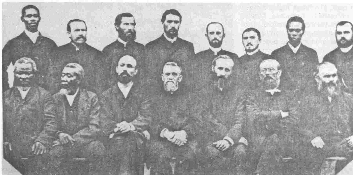
Misioneros Moravos de la Reserva Mosquita

"La Iglesia Morava influyó poderosamente en la comunidad negra, y entró a competir también, por el poder de La Mosquitia".