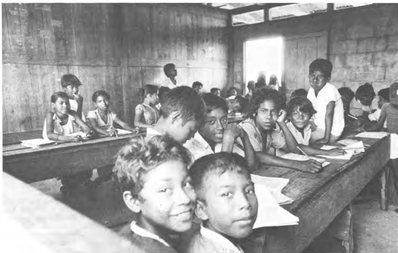
Miskitos, Krukira, 1985.