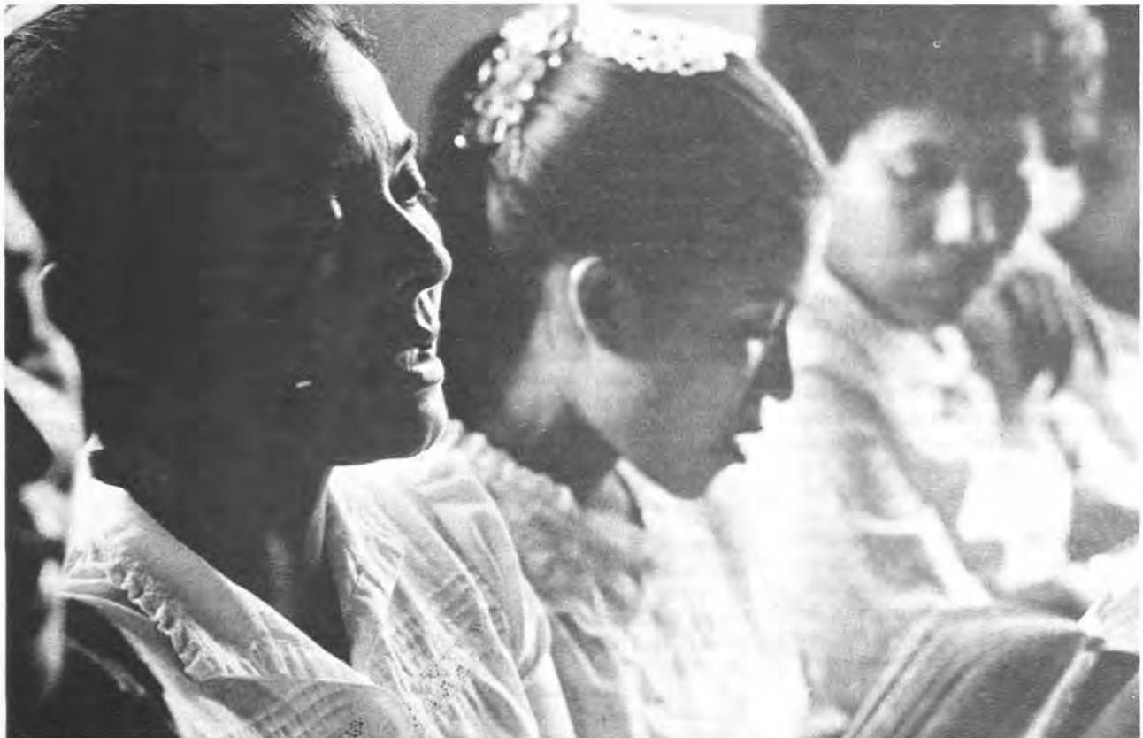
Culto moravo, Sandy Bay, 1990.

turalmente dependientes. El proyecto de castellanización ejecutado por el Ministerio de Educación Pública de Nicaragua, auspiciado y dirigido técnicamente por la UNESCO — ver Minano García (60) — fue una muestra de cómo la teoría establecida a principios de los años 60 influyó, decididamente, la situación socio-cultural y