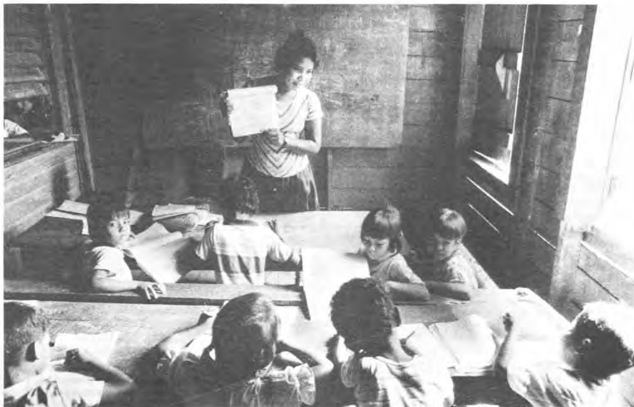
Miskitos, La Tronquera, 1988.

3. En marzo de 1991, el equipo sumu fue trasladado a Puerto Cabezas, desde donde tendrá que atender a las comunidades. El difícil acceso a las mismas, que ya era cierto cuando radicaba en Rosita, se verá considerablemente aumentado.