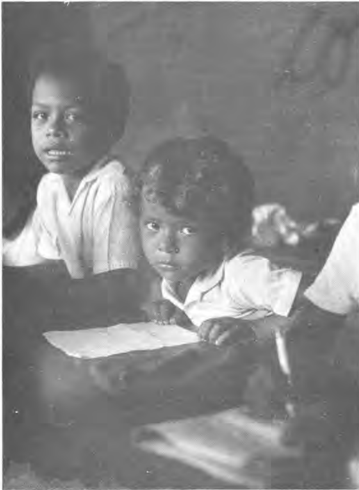
Barrio Cocal, Puerto Cabezas, 1985.