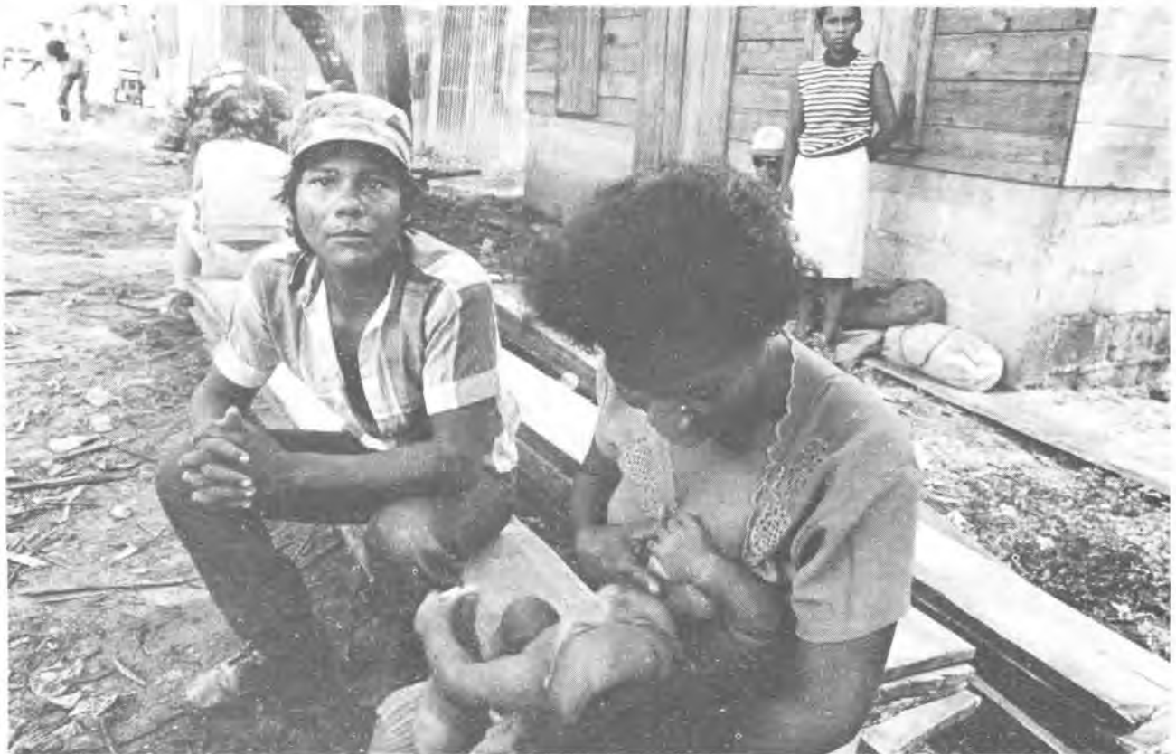
Puerto Cabezas, esperando ayuda.