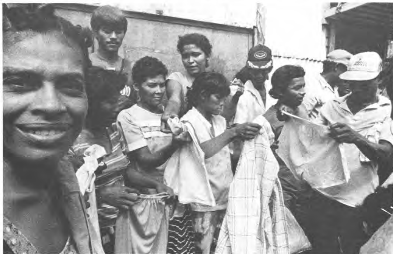
Distribución de ropa, Puerto Cabezas, 1990.