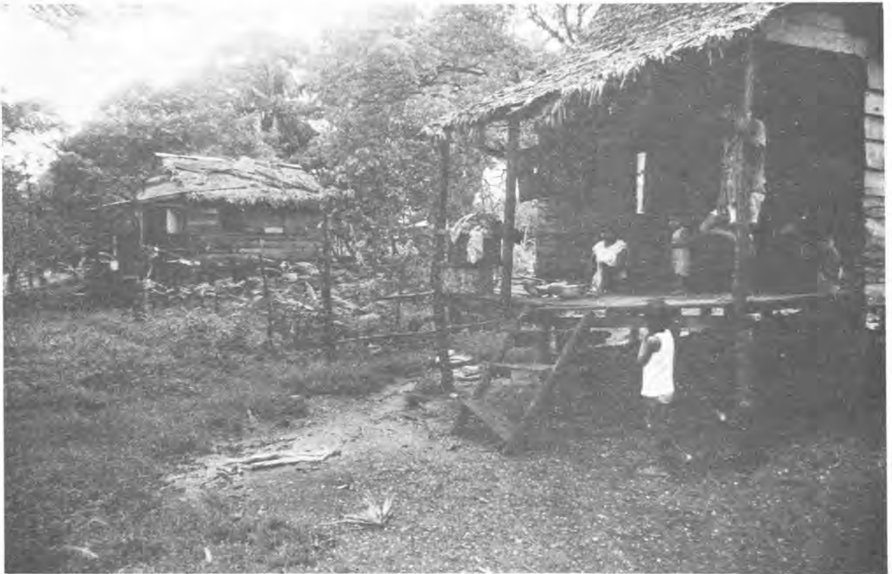
Barrio Cocal, Puerto Cabezas, 1985.