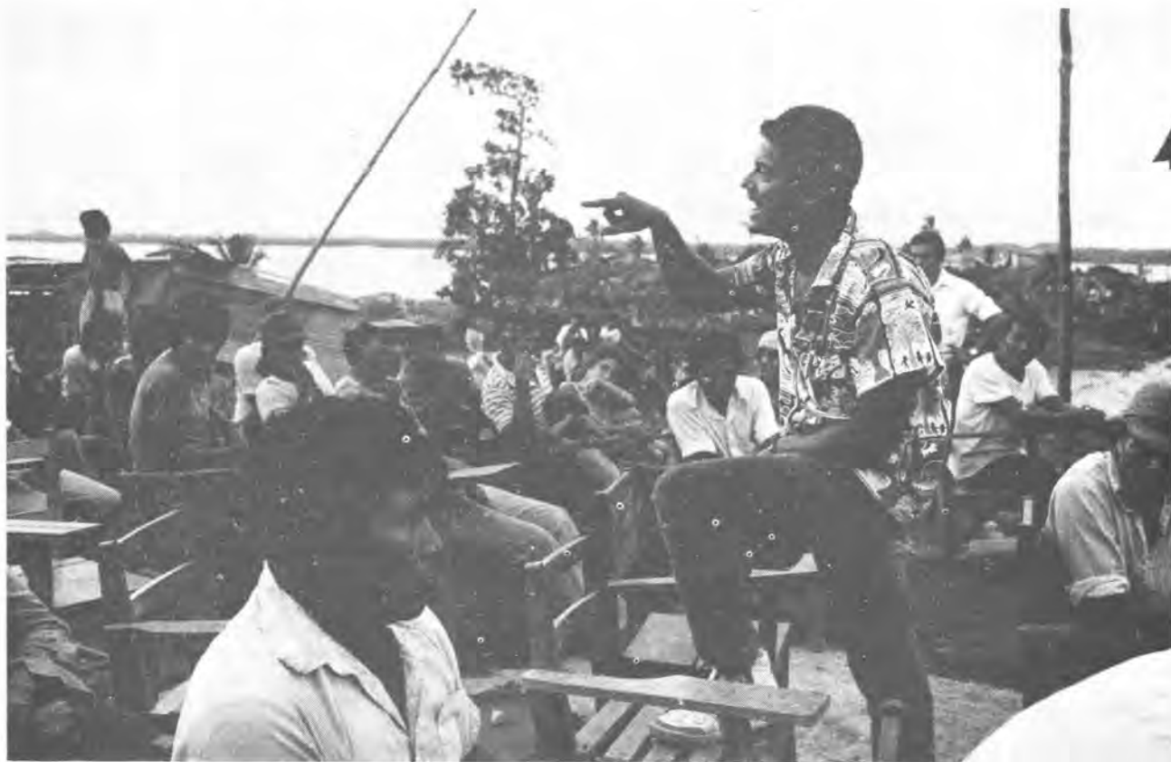
Campaña electoral, Rama Cay, 1989.