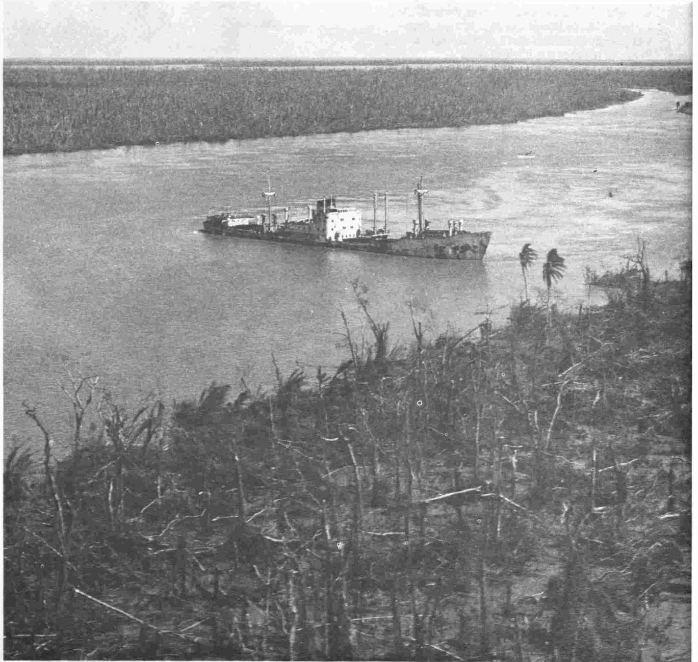
Río Escondido, 1988.