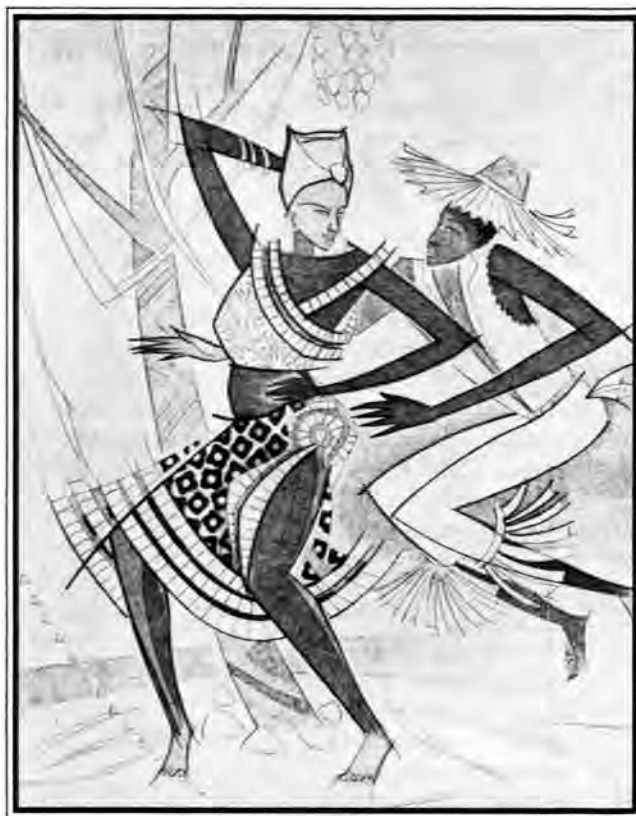
Baile del Palo de Mayo, pintura de Augusto Silva

(Niños jugando por doquier Risas por todos lados. Cuando las canicas y el beisbol son un festín, es cuando el verano llegó»)