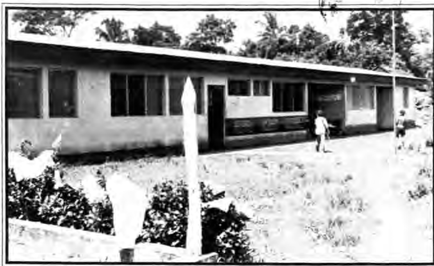
Hospital Ausberto Gutiérrez de la Cruz de Río Grande, 1980.