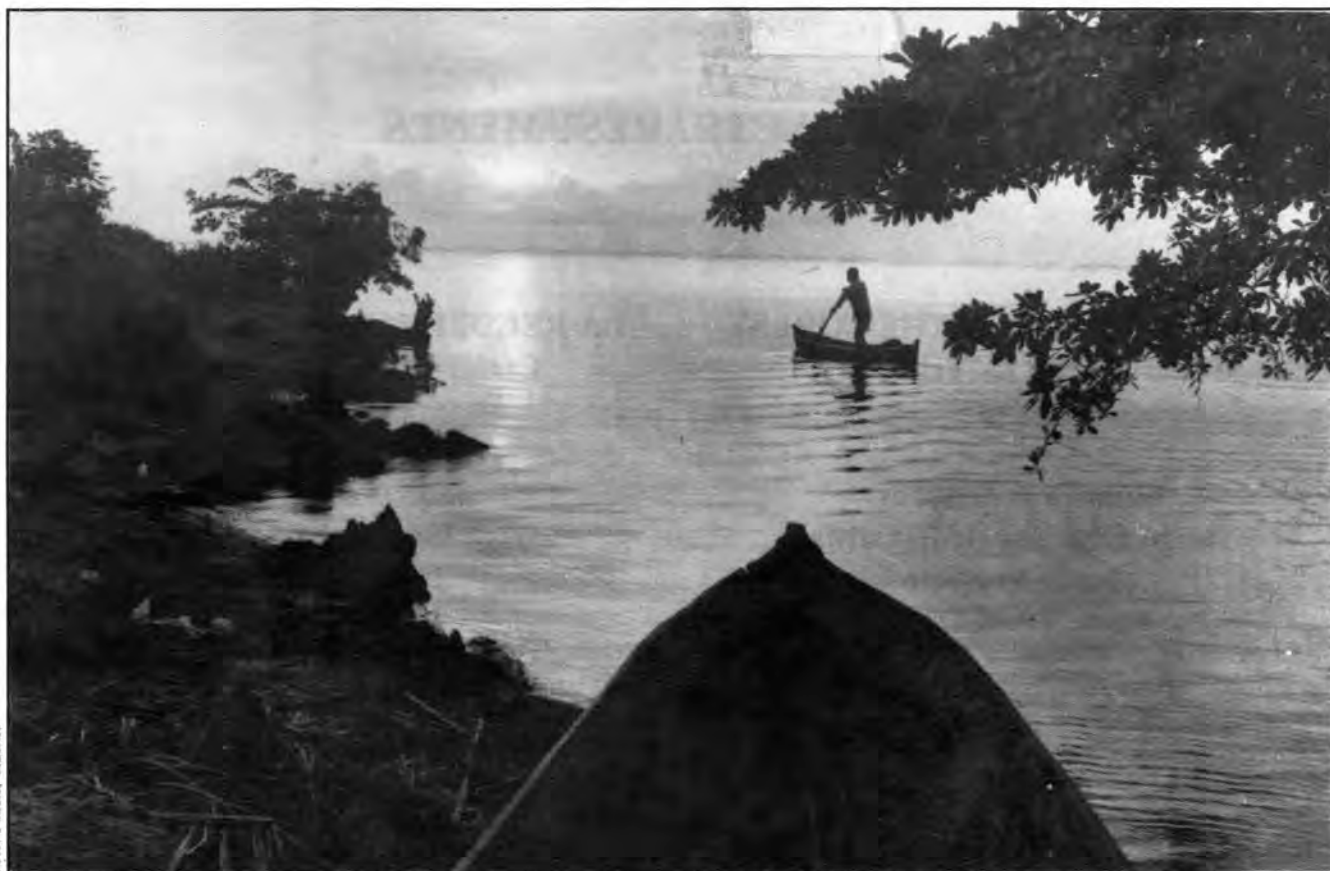
Laguna de Perlas es una de las lagunas costeras más prístinas de Centroamérica.