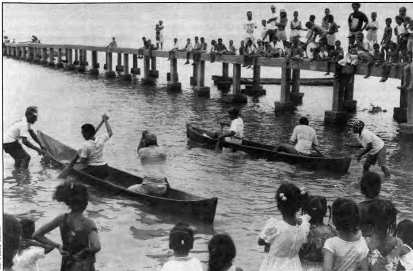
Competencia de cayucos a lo largo del muelle de Orinoco.