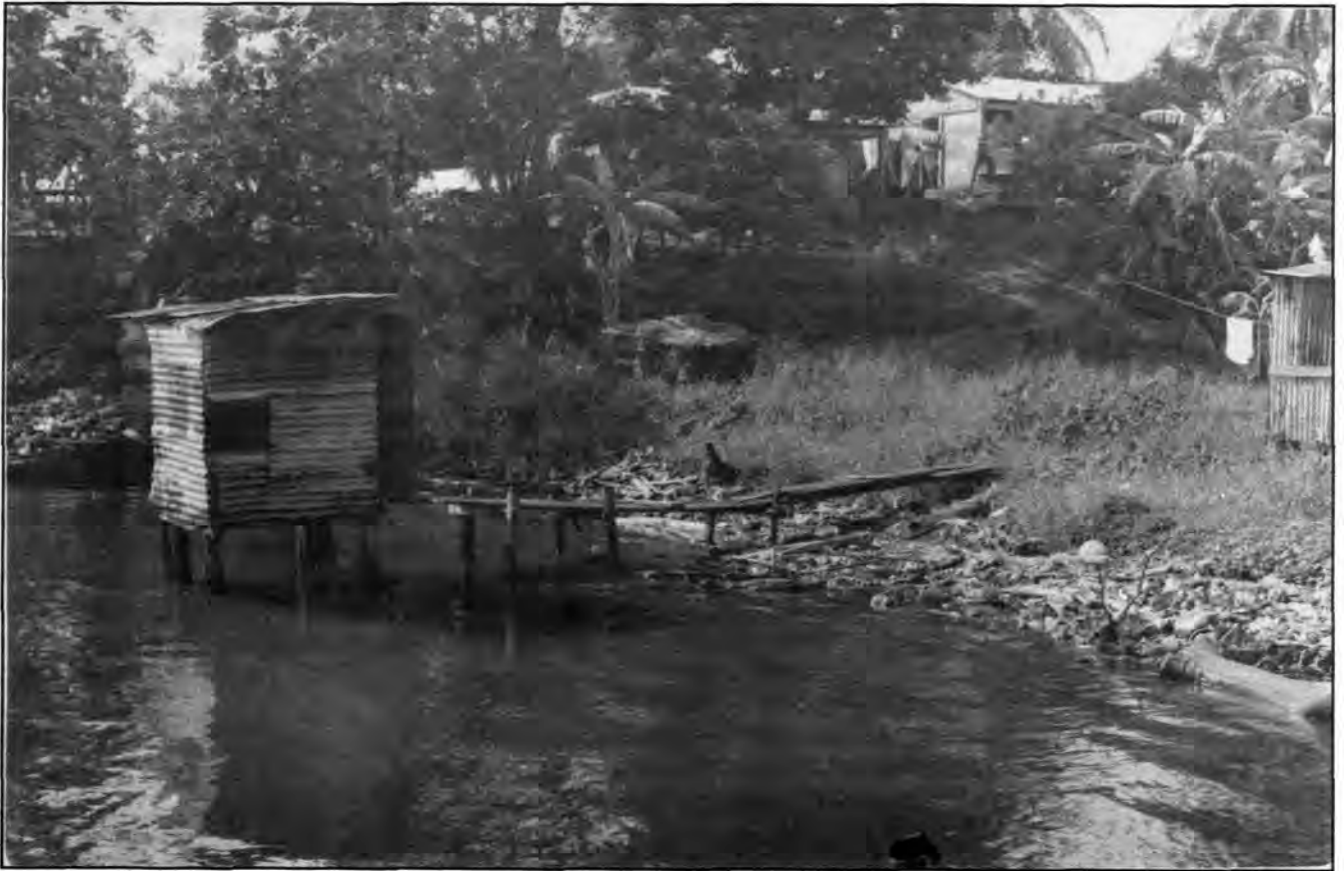
Las letrinas a lo largo del borde de la laguna no son numerosas, sin embargo, éstas representan un riesgo para la salud humana.

de nutrientes proveniente de los ríos es un proceso esencial para mantener esta alta productividad, cambios recientes en el uso de la tierra, y el posible incremento subsecuente en los niveles de sedimentación, han sido identificados tanto por los pobladores locales como por científicos (Ryan 1992, Robinson 1991) como uno de los problemas ambientales de primordial importancia para Laguna de Perlas. Si la turbidez de la laguna se incrementara, aquellas especies que no toleran la sedimentación (e.g. ostras) podrían ser afectadas. De importancia especial es la reacción negativa del phytoplankton cuya habilidad de fotosintetizar es reducida. Esto reduciría la producción de oxígeno, reduciéndose así los niveles de oxígeno disuelto disponibles para otros organismos. A medida que las partículas sólidas en suspensión absorben luz, los niveles de temperatura del agua pueden