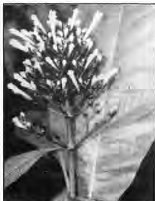
Yellow red garfy