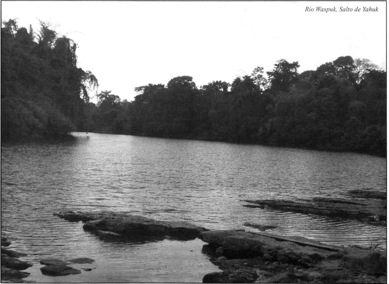
Río Waspuk, Salto de Yahuk