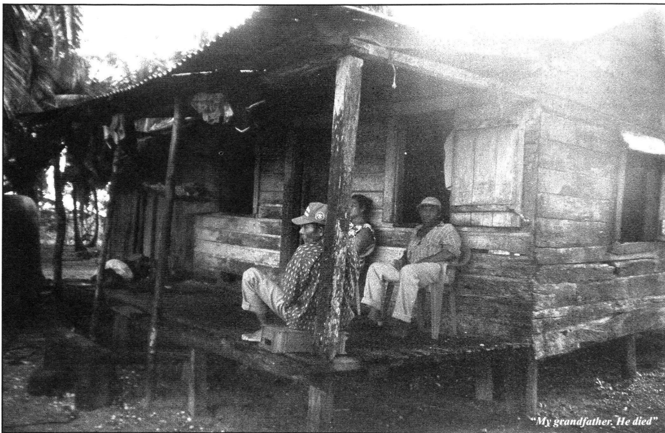
"My grandfather. He died"

trumento, que con eso podríamos comenzar y avanzar en esa dirección.