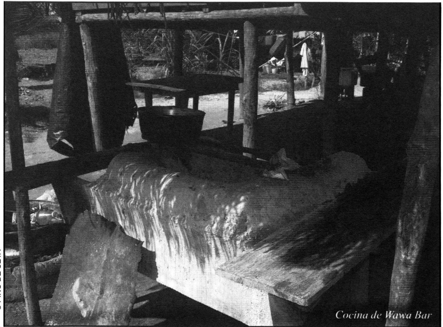
Cocina de Wawa Bar

Venimos sosteniendo que los derechos de los pueblos indígenas son derechos humanos. Y para el ejercicio pleno de estos derechos tenemos que crear un marco jurídico-político que asegure el pleno goce de estos derechos. Y eso es lo que la autonomía asegura, pues es un espacio legal y político, que reconoce la identidad, la propia cultura y el derecho de ser distintos dentro del Estado Nacional. Entonces, con la Autonomía se puede procurar estos derechos que son parte de los derechos humanos. Por ejemplo, en Nicaragua se habla de todo tipo de propiedad, especialmente de la propiedad privada, que es la banderita que se levanta ahí en el sector privado, en el Gobierno y en todos los partidos. Eso no llega a las comunidades. Aquí tenemos que hablar de la propiedad de las comunidades, de la propiedad colectiva, de la propiedad territorial, propiedad de todo un pueblo. Lo mismo sucede con sus recursos naturales, sus autoridades, sus formas de resolver los problemas y de alcanzar niveles de vida más humanos. Se trata de asegurar el espacio mate-