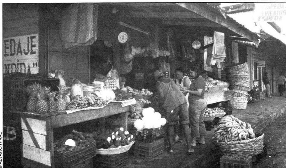
© ALVARO RIVAS Pequeño mercado en el muelle de Bluefields, 2006.

Bueno, los compromisos son de todos y todas las personas involucradas. Uno de ellos es que vamos a seguir acompañando las comunidades en la parte financiera y técnica de la elaboración de sus diagnósticos. Vamos a trabajar con la OTR en los títulos otorgados en las tierras y comunidades indígenas. Estamos analizando ese procedimiento. También trabajaremos muy de cerca con los ONG's en programas tanto de financiamiento como técnicos. Queremos adquirir un compromiso con la comunidad internacional y presentar el avance del proceso de demarcación en países en donde también se están implementando procesos de demarcación y titulación, como Colombia y Brasil, por ejemplo. Queremos absorber la experiencia de estos procesos, no para copiarla porque somos diferentes, pero sí para ampliar y mejorar nuestra metodología, y titular. Titular, cumplir con el sueño de los comunitarios.