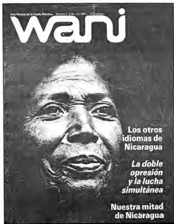
Primer número de Wani .

Nosotros en el CIDCA-UCA estamos muy orgullosos de llegar con esta edición al número 51 de Wani la revista del Caribe nicaragüense . Esto ocurre veinticinco años después de fundado el Centro. Hemos hecho dos números al año como promedio anual a través de nuestra ya larga historia (cuatro anuales en los últimos cinco años). Estamos orgullosos de cumplir veinte y tantos años de representar al pensamiento de y sobre la Costa en la asamblea de publicaciones periódicas nacionales. Pensamos que lo hemos hecho decorosamente, y por eso queremos que lo celebren con nosotros.