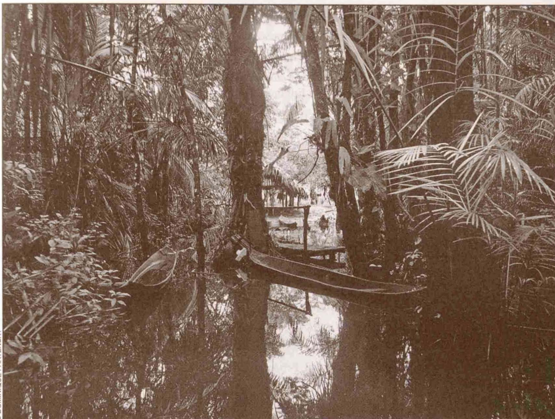
El escondite del sukia.