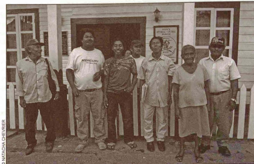
Consejo de Hablantes del Rama delante de las oficinas del BICU-CIDCA, Bluefields, Marzo 2011.

transmisores del rama en las diferentes escuelas de las comunidades (Apr.J. y Apr.S, al igual que dos o tres colegas más).