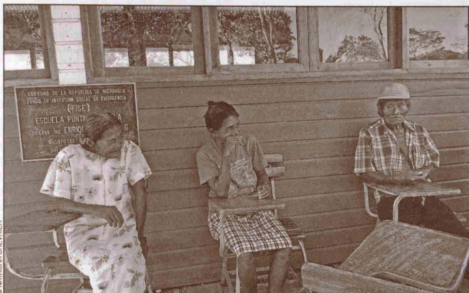
Sesión de trabajo con hablantes en Bangkukuk Taik, Marzo 2011.

La nasal velar es un fonema bastante raro en las lenguas del mundo, pero es muy común en el rama y puede aparecer en todas las posiciones: